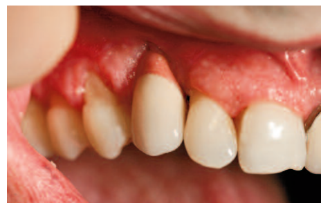
Vollkeramikkrone in der Anwendung