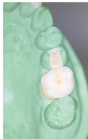
Keramikinlay und Keramikkrone