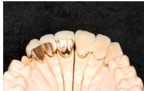
Teil- und vollverblendet

Nachteil: Allergische Reaktion auf Metalle möglich, u.U. sichtbarer Metallrand